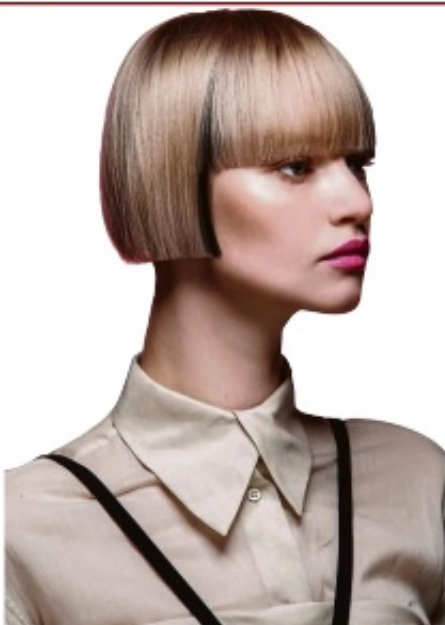
Der vielseitige Allrounder: In dieser Saison wird der Bob glatt und mit gerader Ponypartie getragen.

3.